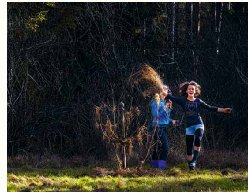
Gelände der Stiftung Nantesbuch. Auf den Spuren der Moorgeister