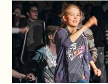
Alles eine Frage der Perspektive