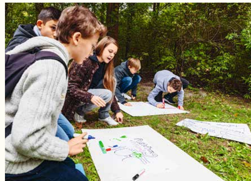
Kunst in der Natur - Natur in der Kunst. Erste Annäherungsversuche im Englischen Garten