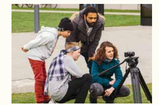
Und Action! Von der Idee bis zum Film den richtigen Dreh finden