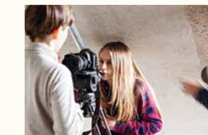
Auge in Auge mit der Kamera