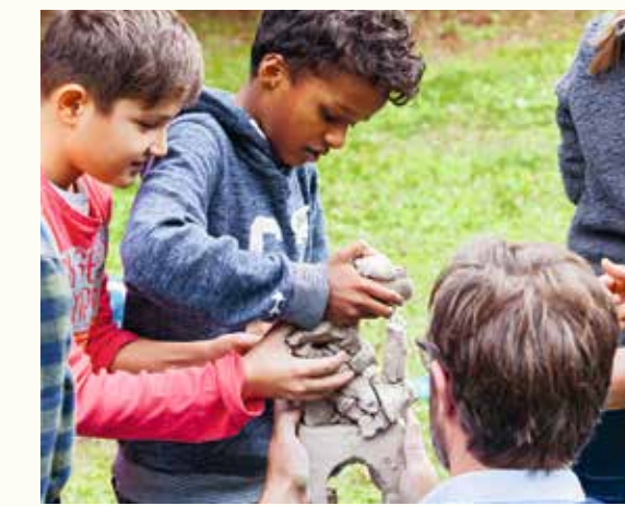
Alles ist möglich. Die Form liegt in der eigenen Hand