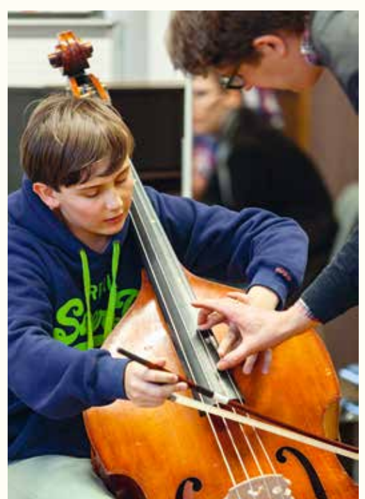
Neue Töne, neue Möglichkeiten