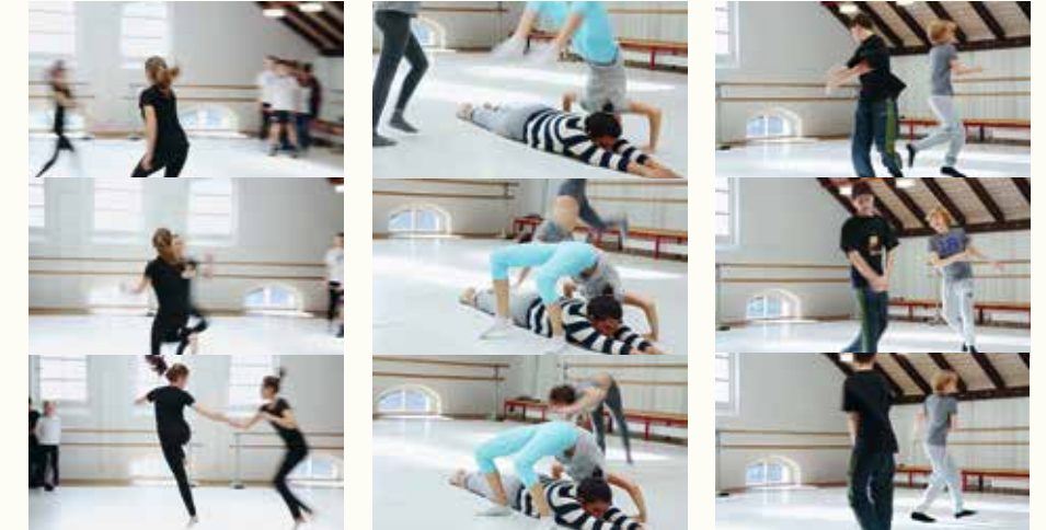
Improvisieren und Choreografieren. Der Tanz kennt viele Sprachen