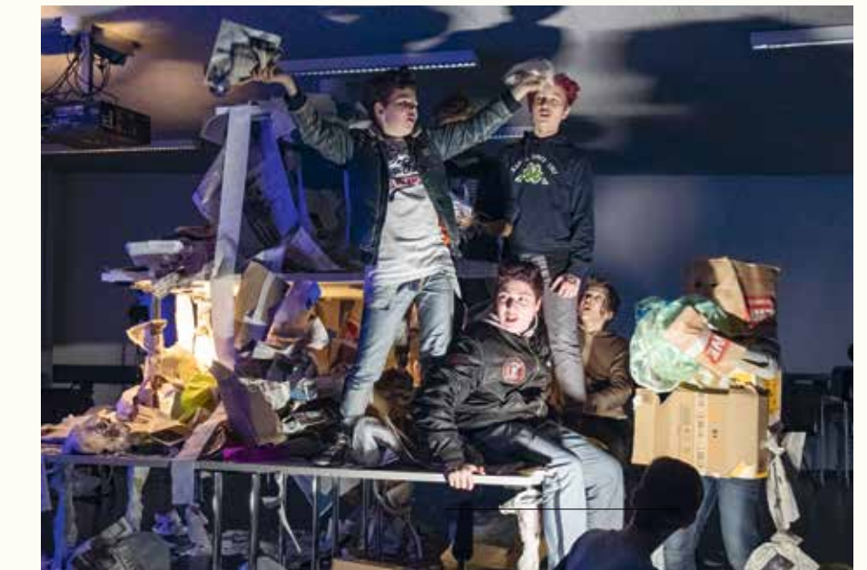
Müllmonster bevölkern die Welt ... - am Filmset in den Räumen der Hochschule für Fernsehen und Film