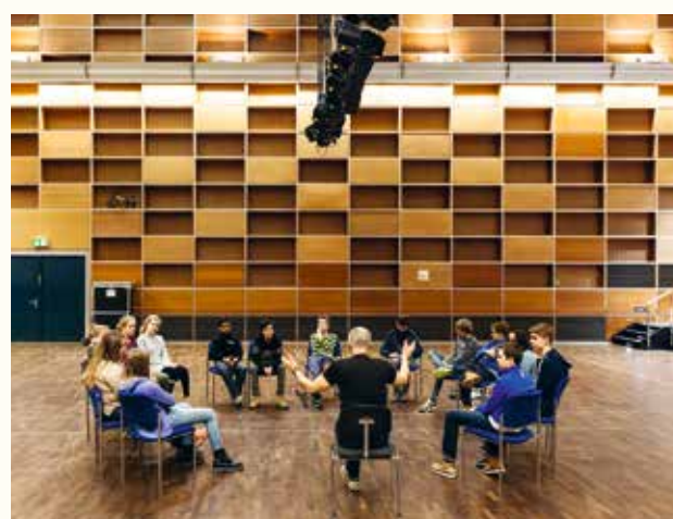
Aus Konzentration wird Klang