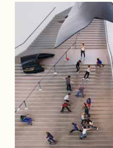
Tanzen in der Welt der Künste. Warmup in der Pinakothek der Moderne