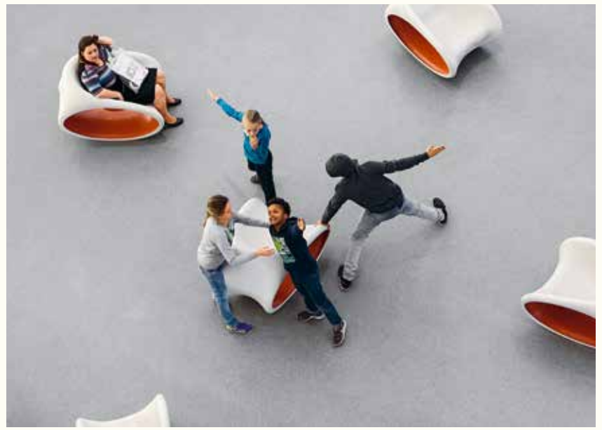
Mit Tänzern aus dem Umfeld des Bayerischen Staatsballetts im Museum. Das gibt es nicht alle Tage