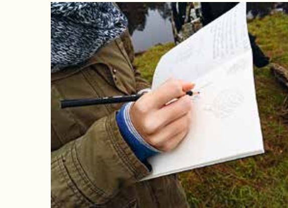
Alles eine Frage der Perspektive