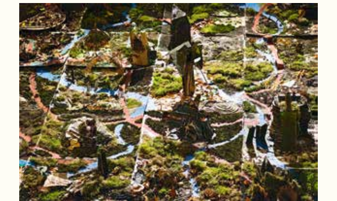
Aus 30 einzelnen Quadratmetern Karton und Materialien aus der Natur entsteht ein großes Moorwald-Landschaftspuzzle