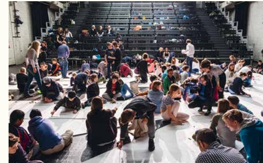
Gestalten, Formulieren, Bewegen - auf der Bühne fühlt sich alles neu an