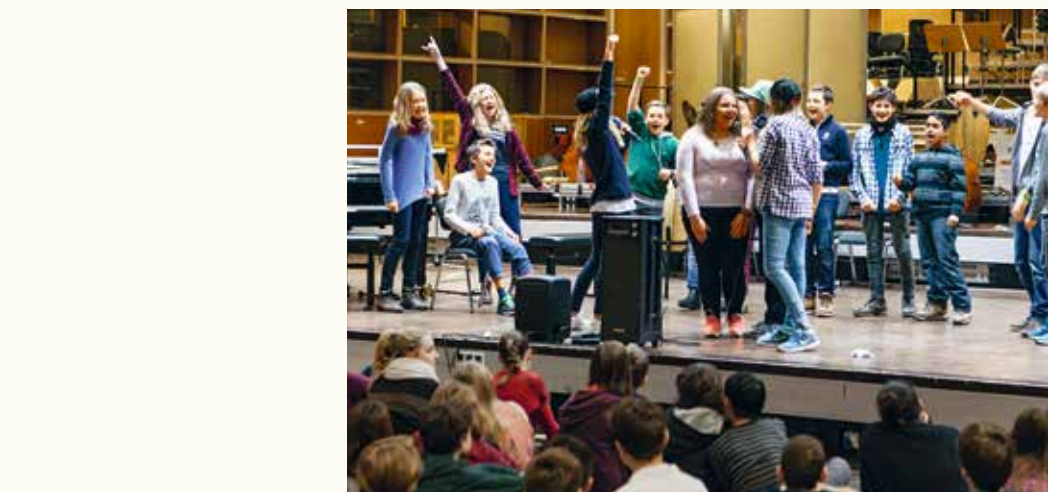
Der ganze Sound des großen Studio 1 des Bayerischen Rundfunks